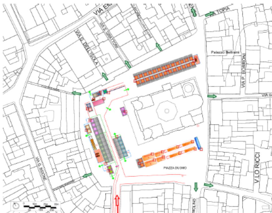
Figura 8. Schema generale dell'Area di PARTENZA

La descrizione integrale della viabilità è in calce alla informativa